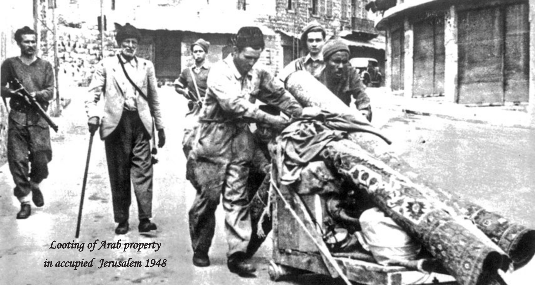
Looting of Arab property in occupied Jerusalem 1948

'MOST OF THE JEWS ARE THIEVES' SAID DAVID BEN GURION IN JULY 24, 1948