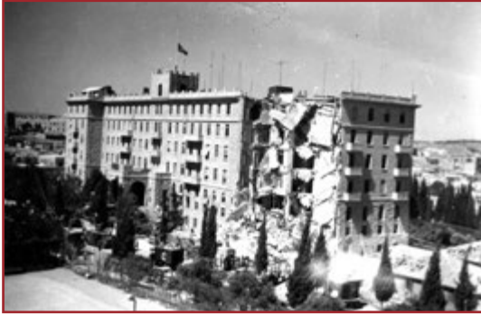
King David Hotel Blown up

Jewish Terrorist acts were undertaken before and after the declaration of the Jewish State. The most infamous was the blowing up of the Kind David Hotel 1946- a major terrorist act after World War II in which 100 civilians working for the British Administration lost their lives (The Jews bit the hand of the British who fed them).