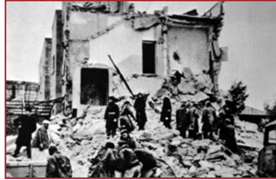
Semiramis Hotel Destroyed

ارتكاب أعمال إرهابية من قبل المنظمات اليهودية قبل وبعد إعلان الدولة اليهودية. الأكثر شهرة كان تفجير فندق الملك داود ١٩٤٦ عام، وهو عمل إرهابي كبير بعد الحرب العالمية الثانية حيث فقد ١٠٠ مدني حياتهم حينها كانوا يعملون لصالح الإدارة البريطانية (قام اليهود بعض يد البريطانيين الذين أطمعهم). ونسفوا أيضا حينها كذلك فندق سميراميس، وهو فندق فلسطيني تملكه عائلة مسيحية في القطمون في القدس الغربية حيث فقد ٢٦ مدنيا حياتهم، وأعمال إرهابية أخرى ارتكبتها المنظمات اليهودية مثل مجزرة ديرياسين في نيسان ١٩٤٨.