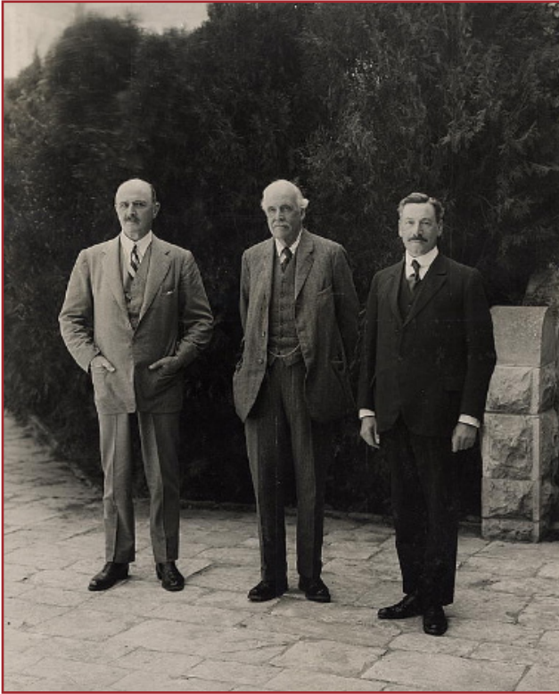
General Allenby, Lord Balfour and Herbert Samuel

The Balfour declaration 1917 Picture of the three English officials who conspired with European Jewry to destroy Palestine and create at the expense of the Palestinian people a Jewish State, for the migrants mainly from Poland and Ukraine.